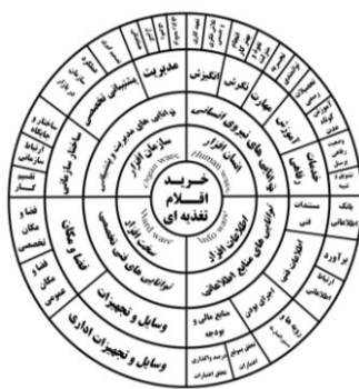
شکل ۳- الگوی مفهومی خرید اقلام تغذیه

در این تحقیق بر اساس مدل اسکاپ ۱ به آسیب‌یابی خرید پرداخته‌شده و اولویت‌بندی عوامل مؤثر بر خرید اقلام تغذیه‌ای مورد بررسی قرار می‌گیرد. برای این منظور، در فرآیند آسیب‌یابی بخش خرید اقلام تغذیه‌ای از شاخص‌های مدل اسکاپ در سطح سازمان استفاده می‌گردد و بر اساس چهار بعد اصلی تأثیرگذار این مدل یعنی، انسان افزار، سازمان افزار، اطلاعات افزار و سخت‌افزار، سیستم خرید مورد بررسی و تجزیه و تحلیل قرار می‌گیرد.