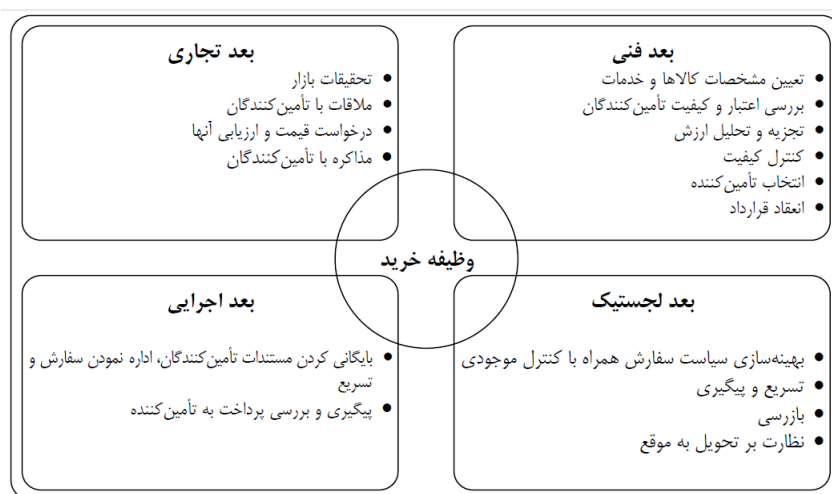
شکل ۲- ابعاد چهارگانه وظیفه خرید سازمانی (وان ویل ۱ ، ۱۹۹۴: ۳۰)

بعد اجرایی: در ارتباط با فعالیت‌های اجرایی است که خرید باید انجام دهد.